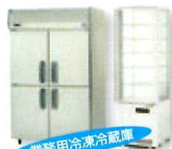
業務用冷凍冷蔵庫