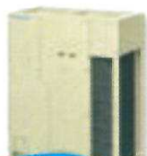
ビル用 マルチエアコン