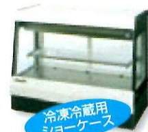
冷凍冷蔵用 ショーケース