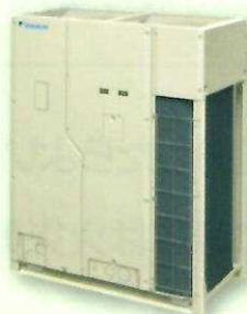
ビル用マルチエアコン