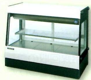
冷凍冷蔵用ショーケース など